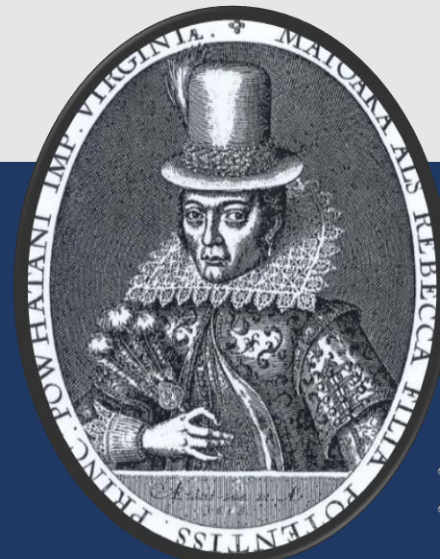
Pocahontas by Simon van de Passe 1616